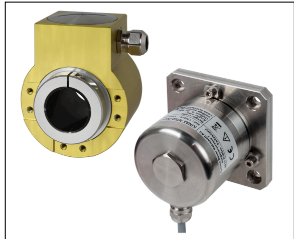
Drehgeber und Neigungssensoren der Serie KINAX. Robust – Zuverlässig – Universell.

Aufgrund einer einzigartigen Mess- und Gehäusekonzeption garantieren die Positionssensoren ein sehr hohes Mass an Genauigkeit, Zuverlässigkeit und Langlebigkeit. Oberstes Ziel ist die langfristige Sicherstellung eines reibungslosen Betriebs von Anlagen, Produktionen und Abläufen.