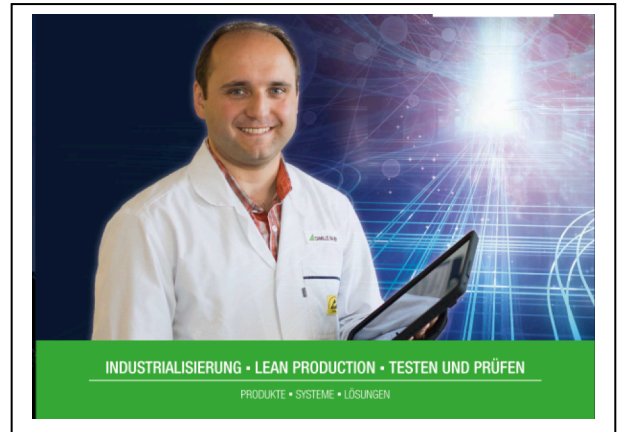
Camille Bauer Metrawatt AG bietet Fertigungs- als auch Beratungsdienstleistungen an.

Nebst den eigenen Produkten, die seit 1944 erfolgreich innoviert, produziert und auch weltweit verkauft werden, nimmt die Camille Bauer Metrawatt AG den Standort Schweiz sehr ernst und weitet das Angebot auf die Fertigungsdienstleistung aus. So können etwaige Produktionsengpässe, Test- und Prüfvorgänge, Industrialisierungen, Service- und Reparaturleistungen als auch logistische Themen übernommen werden. Dabei werden Normen, Richtlinien und Zertifikate wie ISO 9001:2015, ISO14001:2015, RoHS, REACH, ATEX, UL, GL IPC-A-610-D usw. angewendet und eingehalten. Die Services werden jeweils auf das individuelle Bedürfnis der Kunden abgestimmt und erstrecken sich auf folgende Kernbereiche: (1) Flexibles und angepasstes Testen und Prüfen von elektrischen Baugruppen und Endgeräten mit verlässlichen Testverfahren und Testeinrichtungen; (2) Elektronische Baugruppenfertigung mit diversen Produktionstechnologien; (3) Endgerätemontage im Inselfertigungsverfahren; (4) Beratung im Bereich Logistik, Verpackung, Lagerhaltung, Kanban, Lean Management, papierlose Fertigung, Industrialisierung, usw.. Sicherheit und Zuverlässigkeit sind dabei die Garanten für einen zufriedenen Kunden. Top motivierte Mitarbeiter freuen sich hierbei auf jede Anfrage.