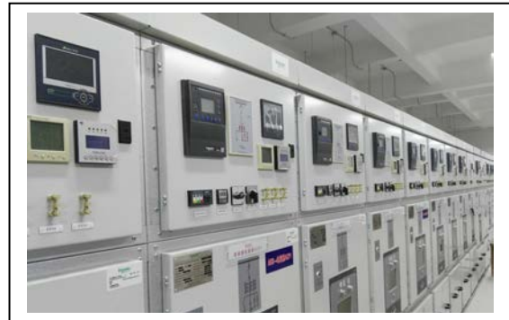
Die Energie des Rechenzentrums wird über mehr als 50 Schaltanlagenkreise im Medium- und Niederspannungsbereich unterverteilt.

(Wohlen CH / Hefei PRC, September 2018) Rechenzentren sind weltweit nicht nur in eigenständiger Form zu finden, sondern kommen in vielen weiteren Bereichen vor. Dazu gehören Banken, Versicherungen, Industrieunternehmen, Hospitäler, Flughäfen, Energieversorger, Behörden usw. Dabei stellt nicht nur der enorme Energiebedarf die Betreiber von Rechenzentren als auch die Energieversorger vor grosse Herausforderungen. Zusätzliche Faktoren, die ad-hoc zu Problemen und schweren Schäden führen können, rücken mehr und mehr in den Fokus. Wie in diesem Use Case aufgeführt, hat sich die HuiShang Bank in Hefei der Provinz Anhui in China dafür entschieden, in das Thema des sicheren 24/7-Betrieb weiter zu investieren. Dabei wurde zusätzliches Equipment zur Überwachung der elektrischen Netzqualität eingesetzt.