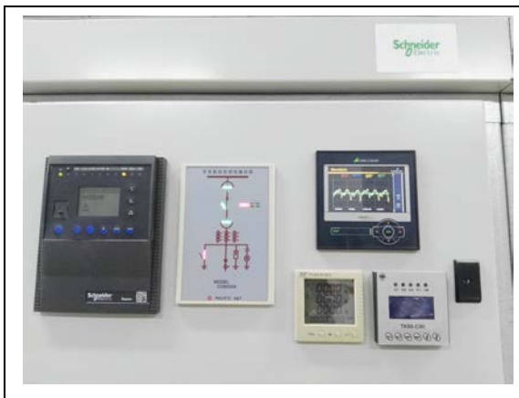
In jeder Schaltanlage ist zur Überwachung der Netzqualität ein SINEAX der Serie AM3000 von Camille Bauer installiert. Hier werden Parameter wie Wellenform und Spannungs-Ereignisse überwacht und bei Abweichungen umgehend gemeldet.

Wie bei allen Betreibern von Rechenzentren ist die Verfügbarkeit im 24/7-Betrieb fundamental. Hierbei werden Verträge mit den Energielieferanten abgeschlossen und systematisch weitere redundante Massnahmen eingeleitet, welche die unterbrechungsfreie Versorgung sicherstellen sollen. Dazu zählen Batteriespeicher als auch Generatoren sowie redundante Versorgungsleitungen in das Rechenzentrum hinein. Allerdings gibt es neben dem Aspekt der quantitativen Versorgungssicherheit der zugeführten Energie noch den qualitativen Aspekt. Dazu zählen, je nach Ausprägung mit oder ohne IEC-Standardisierung (z. B. nach IEC 61000-4-30, Kapitel 5.1 - 5.12, Klasse A), Oberschwingungsspannungen, Flicker, Spannungseinbrüche, Spannungsüberhöhungen, Transienten, schnelle Spannungsänderungen (RVC), usw. Die Auswirkungen auf diese Phänomene können den Servern und der Infrastruktur nachhaltig schaden (z. B. unkontrolliertes Herunterfahren der Maschinen, Generieren von Anlagen-Defekten, usw.) und müssen deshalb frühzeitig erkannt werden.